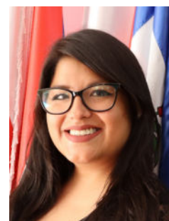
Soledad Soto COMUNICACIÓN